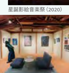
てまひま蔵ギャラリー展示 (2024)