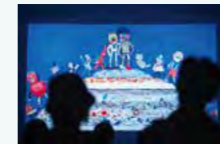
大山アニメーション祭 (2015)

発行日 2024年12月1日 発行 一般社団法人鳥取クリエイティブプラットフォーム 協力 こっちの大山研究所、鳥取藝住実行委員会 編集・デザイン 大下志穂