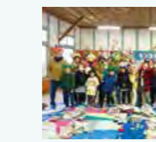
大山ガガガ学校 冬 (2018)