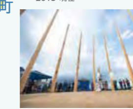
星のことほぎ祭り (2022)