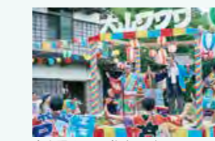
大山踊るワワワ祭 (2016)