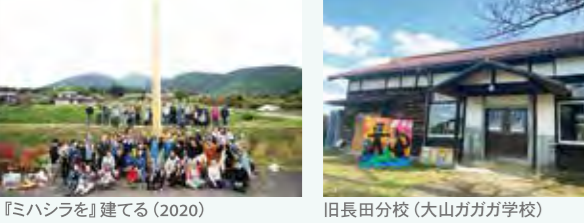
『ミハシラを』建てる (2020) 旧長田分校 (大山ガガガ学校)

孝霊山の裾野に広がる集落に現在、約50世帯150人ほどが暮らしています。弥生時代の大規模集落跡『むきばんだ史跡公園』に隣接し、山からの豊かな水にも恵まれ、古来から栄えてきた集落です。先人たちが、かつて渡来人を受け入れてきたように、移住者や藝術祭を受け入れ、本格的なミュージカルにも挑戦するなど、外の力を活力に変える柔軟性と包容力はこの土地と人が受け継いできた強さそのもの。