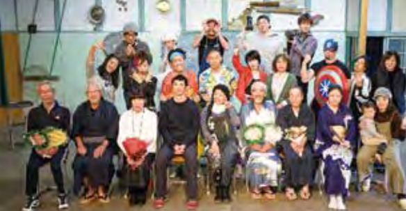
長田舞踏ミュージカル☆伝統ブギ (2019) / 脚本・演出 目黒大路

孝霊山の裾野に広がる集落に現在、約50世帯150人ほどが暮らしています。弥生時代の大規模集落跡『むきばんだ史跡公園』に隣接し、山からの豊かな水にも恵まれ、古来から栄えてきた集落です。先人たちが、かつて渡来人を受け入れてきたように、移住者や藝術祭を受け入れ、本格的なミュージカルにも挑戦するなど、外の力を活力に変える柔軟性と包容力はこの土地と人が受け継いできた強さそのもの。