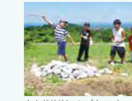
大山ガガガキャンプ (2017)