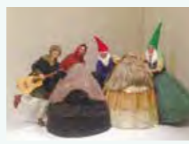
森まもりの森の中 (2016)